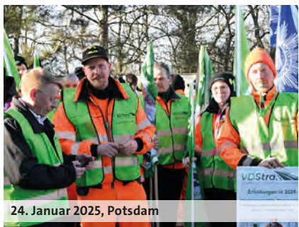
24. Januar 2025, Potsdam